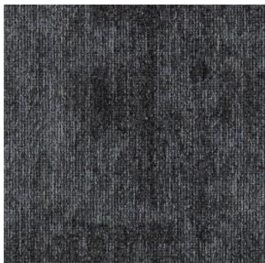
Color : 965