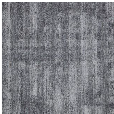
Color : 957